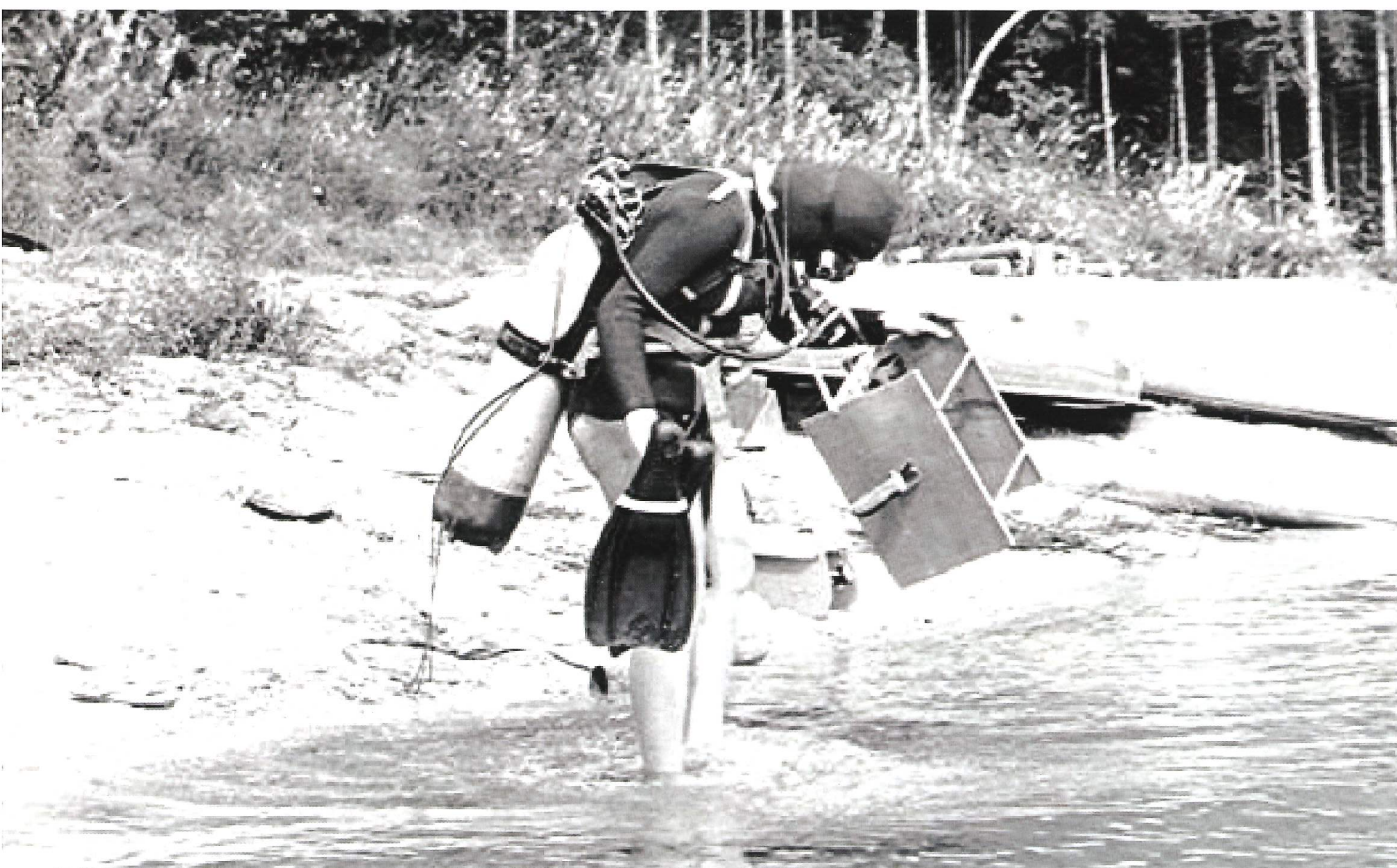
Píše se rok 1970 - krátké ploutve a na zádech láhev 12 litrů - to byla dřina.

bych chtěla zmínit, že ne vše bylo dříve zcela špatné - např. ve střediscích vrcholového sportu bylo finanční zajištění jak trenérů, bazénů a v neposlední řadě i závodníků. Získat dnes sponzorské prostředky alespoň na bazén stojí všechny, kteří se snaží tyto prostředky zajistit, mnoho úsilí - nakonec je to stejně nejvíce na rodičích. A trenéři? Alespoň já to dělám zdarma, tzv. pro potěšení. Přitom firma, která například vyrábí sportovní potřeby pro tenis, či jiný sport, samozřejmě sponzoruje své sportovce či trenéry. Bohužel, to u potápění neplatí. Ještě více mě však mrzí zvláštní přístup: když jsme chtěli požádat o grant proto, aby mládež místo „fetu“ mohla sportovat. Se zlou jsme se potázali, protože nám bylo vysvětleno, že sport mládeže nepatří do protidrogové prevence. Ale k tomu není co dodat.