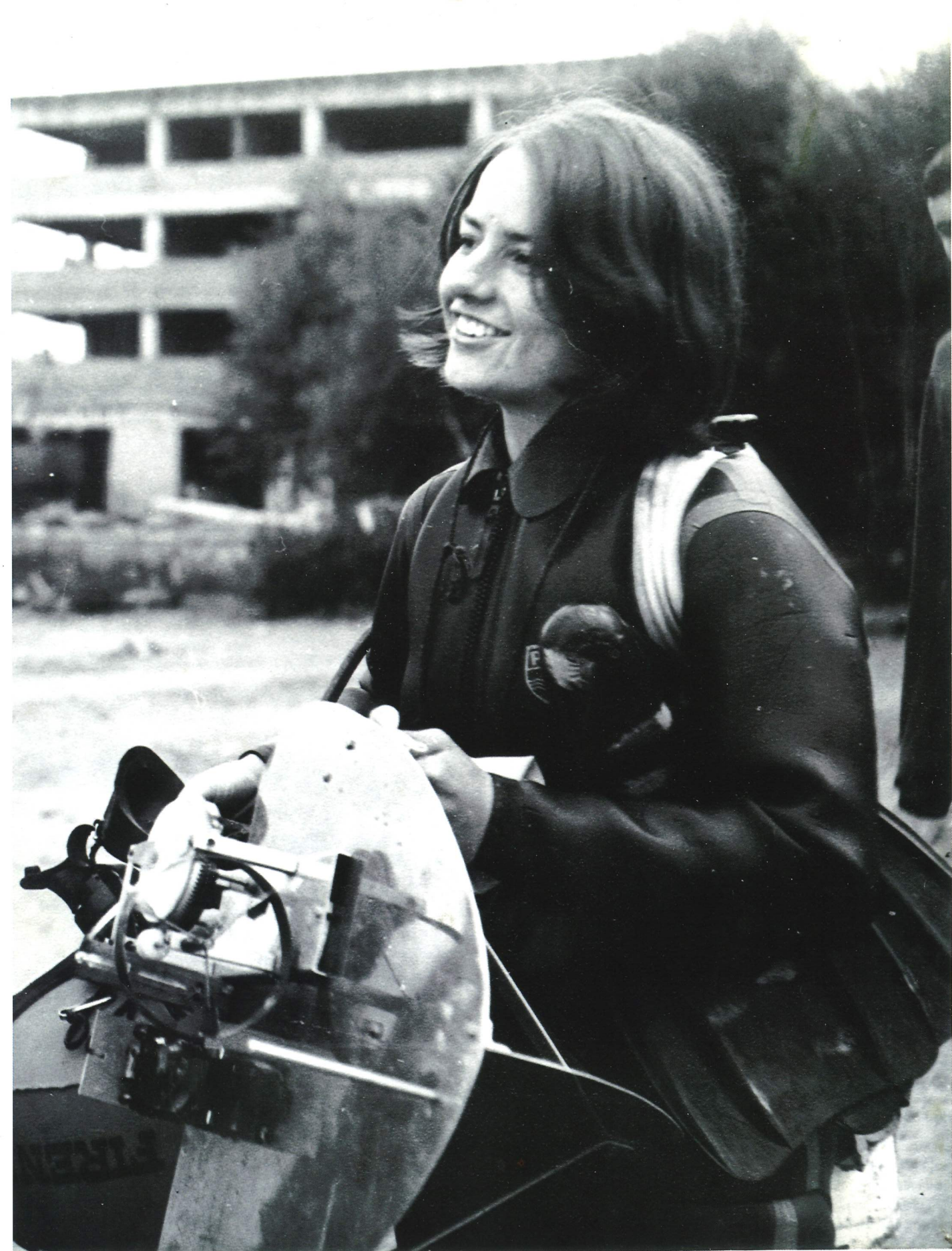
První vlastní a vlastnoručně vyrobené orientační zařízení - soustředění reprezentantů - Orava 1966.

Pražské závodění v ploutvích či v orientaci, jak jsem již uvedla, bylo obnoveno v roce 1973 založením potápěčského klubu Aquacentrum. V něm se šlo několik absolventů plavecké školy, kteří již dále do plaveckého střediska nebyli vybráni. A s těmi jsem začínala svou trenérskou